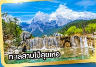
ทะเลสาบไป๋สือเหอ