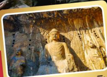
ผาแกะสลักหลงเหมิน