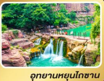
อุทยานหยุ่นโกซาน