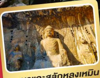
ผาแกะสลักหลงเหมิน