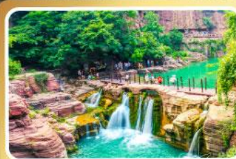
อุทยานหยุ่นโกซ่าน