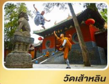
วัดเส้าหลิน