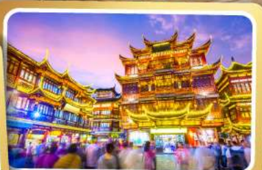
ตลาดร้อยปีเจิ้งหวงเมี่ยว

สนุกสุดมันส์ไปกับเครื่องเล่น Shanghai Disneyland เต็มวัน