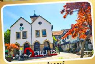
เทมส์ทาวน์