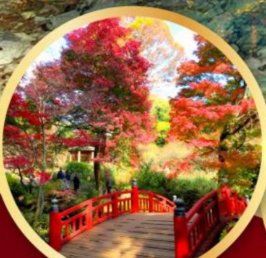
สวนดอกบ๊วยจากามิ