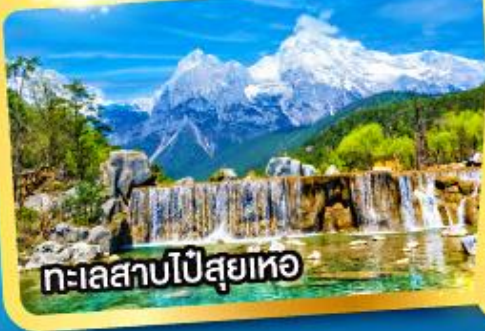
ทะเลสาบไป๋สฺยเหอ