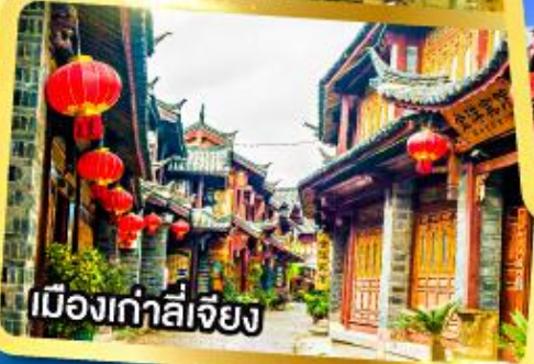
เมืองเก่าลี่เจียง