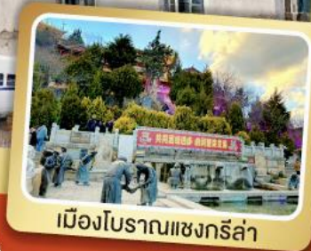
เมืองโบราณแชนกรีล่า