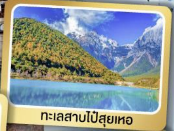
ทะเลสาบไป๋สฺยเหอ