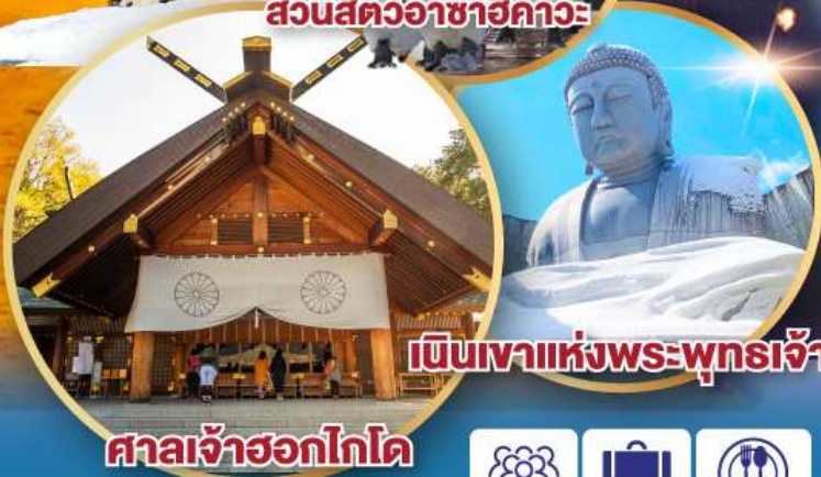
เป็นเขาแห่งพระพุทธรเจ้า