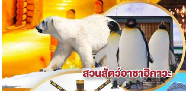
สวนสัตว์อาซาฮิกาวะ