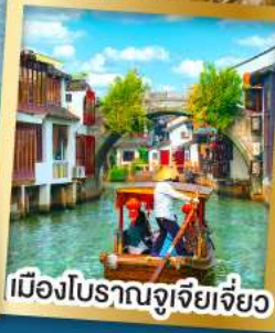
เมืองโบราณจูเจียเจี๋ย