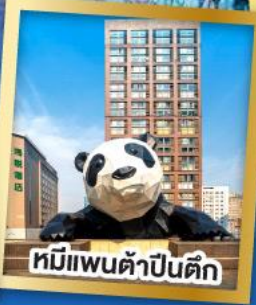
หมีแพนด้าปิ่นตึก