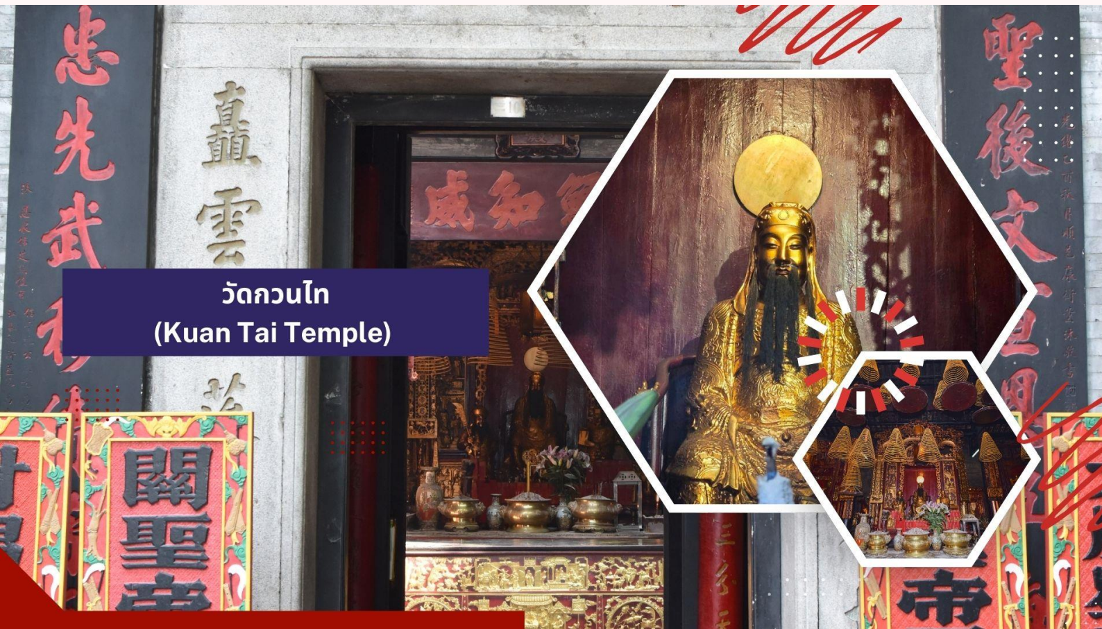
วัดกวนไท (Kuan Tai Temple)

นำท่านเดินทางสู่ วัดกวนไท (Kuan Tai Temple) หรือรู้จักกันในชื่อ วัดซาไกวุกุณ (Sam Kai Vui Kun Temple) เป็นวัดที่มีความสำคัญทางประวัติศาสตร์และวัฒนธรรมในมาเก๊า ได้รับการขึ้นทะเบียนเป็นมรดกโลกของ UNESCO ร่วมกับศูนย์กลางประวัติศาสตร์มาเก๊าในปี ค.ศ. 2005 เนื่องจากคุณค่าทางประวัติศาสตร์ สถาปัตยกรรม และวัฒนธรรมที่โดดเด่น ตั้งอยู่ใจกลางจัตุรัสเซนาโด้และรายล้อมไปด้วยอาคารสไตล์ยุโรป วัดนี้สร้างขึ้นเมื่อปี ค.ศ. 1750 และเป็นที่ยึดเหนี่ยวจิตใจของชาวมาเก๊า ซึ่งเป็นเทพเจ้าแห่งความมั่งคั่งและปกป้องคุ้มครอง วัดแห่งนี้มีเป็นที่นิยมของผู้ทำธุรกิจ ตำรวจ และนักการเมือง เพราะเชื่อว่าสามารถปกป้องสิ่งชั่วร้ายต่างๆ และช่วยเสริมอำนาจบารมีในการปกครองและคุ้มครองบริวาร