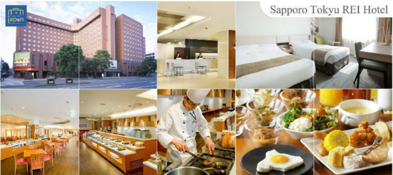
Sapporo Tokyu REI Hotel

รับประทานอาหารเย็น ณ ภัตตาคาร (7) --- พิเศษ!!! เมนู ซาบู่ + ซาบู่ SAPPORO TOKYU REI HOTEL หรือเทียบเท่าระดับเดียวกัน