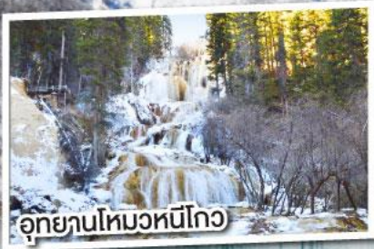
อุทยานโหมวหนีโกว