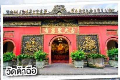
วัดต้าอ้อ