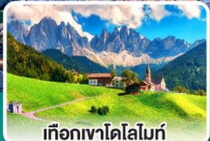
เทือกเขาโดโลไมท์