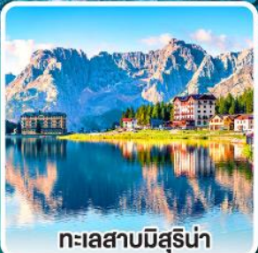
ทะเลสาบมิสุรีน่า

เข้าชมมหาวิหารเซนต์ปีเตอร์ ที่ใหญ่ที่สุดในโลกแห่งนครวาติกัน