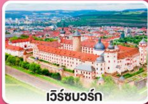
เว็ร์ชบวร์ค