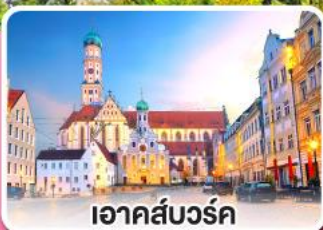
เอาคส์บวร์ค