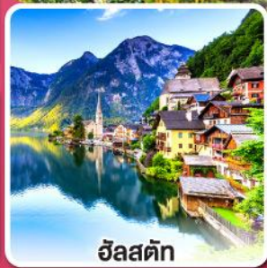
อินส์บรึค