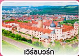
เว็ร์ชบวร์ค