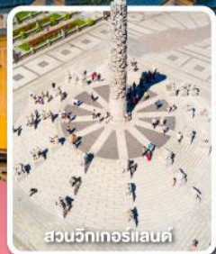
สวนวีกเกอร์แลนด์