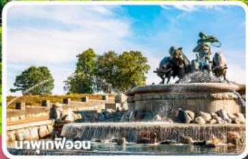
น้ำพุร้อน