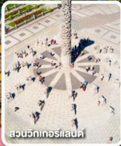
สวนวิกทอเรียแลนด์