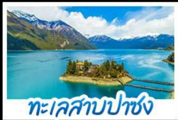
ทะเลสาบปาซง

รถไฟสายหลังคาโลก พระราชวังโปตาลา วัดโจคัง - ทะเลสาบปาซง พระราชวังฤดูร้อนนอร์บูลิงคา