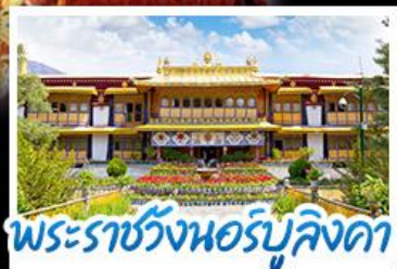
พระราชวังนอร์บูลิงคา