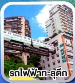
รถไฟฟ้ากะลุดัก