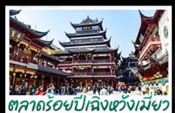
ตลาดร้อยปีฉงชิ่งเหมียว