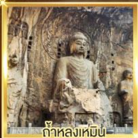
ถ้ำหลวงเหมิน