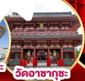
วัดอาซากุซะ