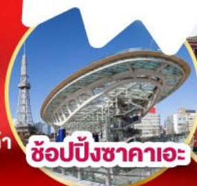
ช้อปปิ้งซาคาเอะ