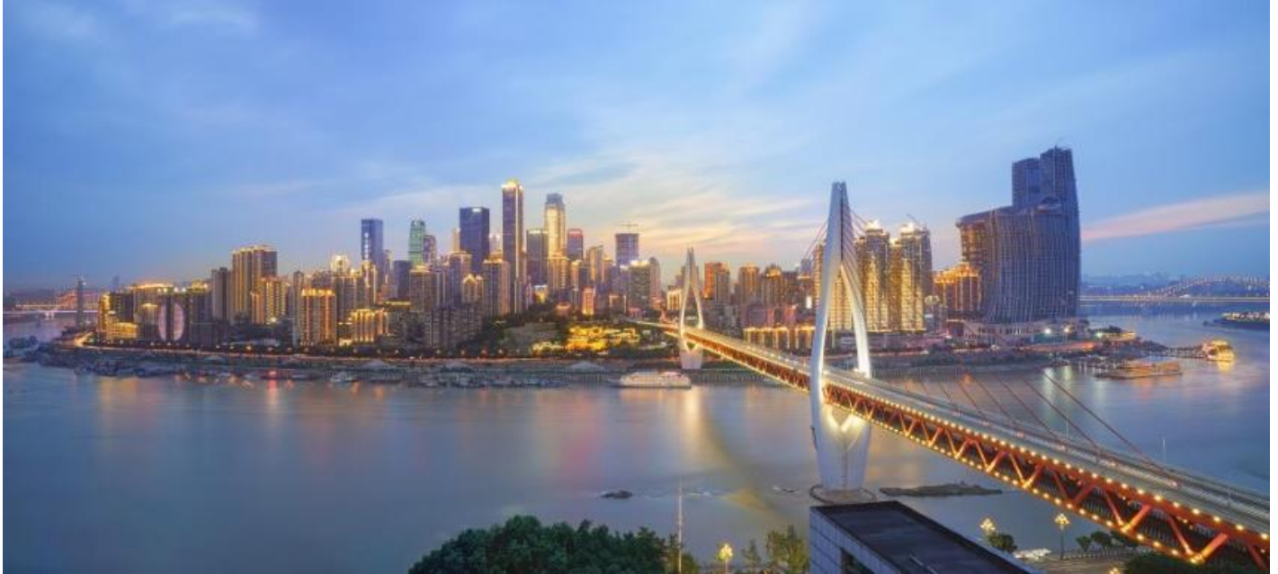
ที่พัก VIENNA HOTEL CHONGQING AIRPORT หรือเทียบเท่าระดับ 4 ดาว (มาตรฐานประเทศจีน)

23.50 น. เดินทางถึง ท่าอากาศยานนานาชาติสนามบินฉงชิ่ง เจียงเป่ย์ เมืองฉงชิ่ง "ฉงชิ่ง" มหานครที่ใหญ่ที่สุดทางภาคตะวันตกเฉียงใต้ของจีน ที่นี่ไม่ใช่แค่เมืองที่มีตึกสูงระฟ้า แต่เป็นเมืองที่เติบโตขึ้นตามแนวภูเขาและโอบล้อมด้วยสายน้ำอย่างน่าอัศจรรย์ ได้รับสมญานามว่า "เมืองแห่งภูเขา" ฉงชิ่งคือบทพิสูจน์ของความสามารถอันน่าทึ่งของมนุษย์ในการปรับตัวและสร้างสรรค์สิ่งก่อสร้างให้กลมกลืนไปกับธรรมชาติที่ท้าทายจากนั้นนำท่านผ่านขั้นตอนตรวจคนเข้าเมือง รับกระเป๋าสัมภาระ จากนั้นนำท่านออกเดินทางเข้าสู่ที่พัก