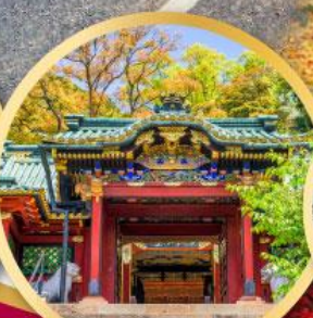
ศาลเจ้าโทโฮคุ