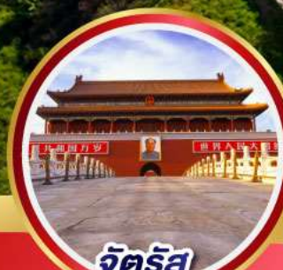
จัตุรัส เทียนอันเหมิน