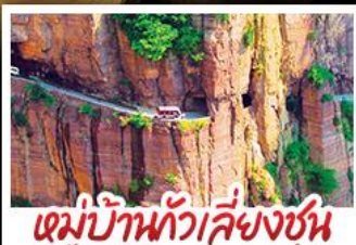
หมู่บ้านกัวลิ่งซุน