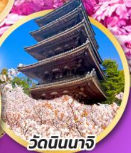
วัดนินนาจิ