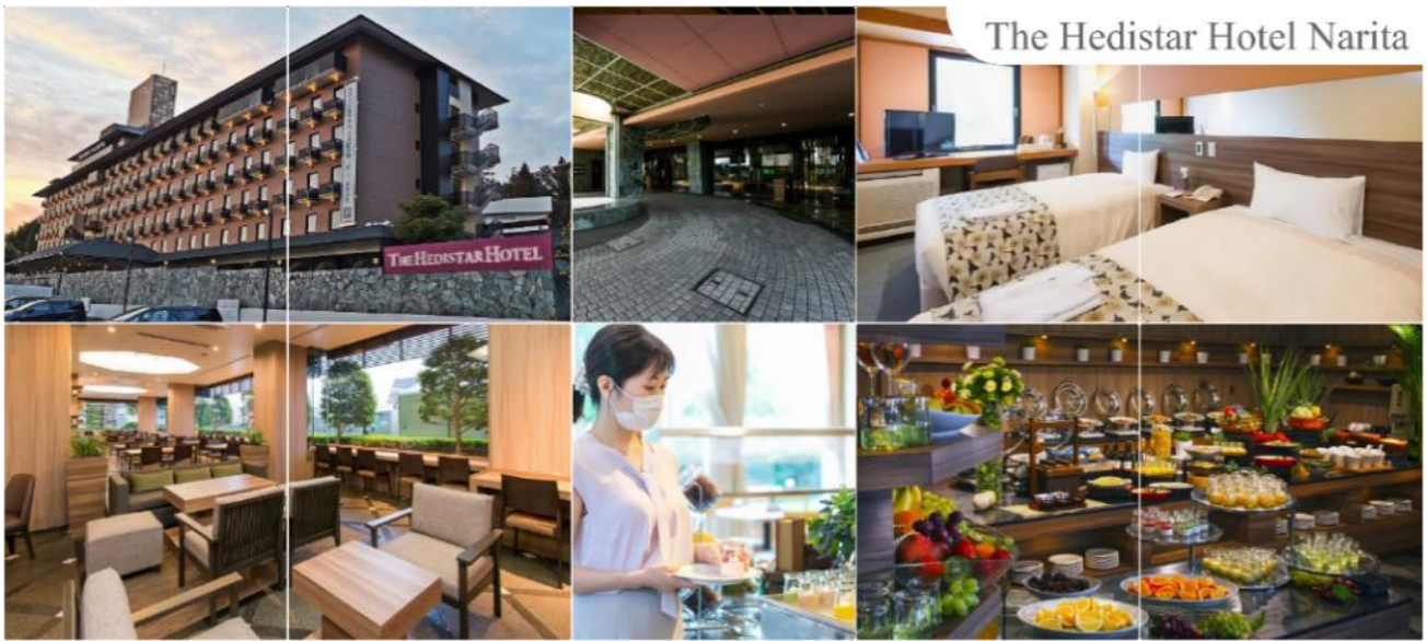
The Hedistar Hotel Narita

THE HEDISTAR HOTEL, NARITA หรือเทียบเท่าระดับเดียวกัน