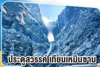
ประตูสวรรค์เทียนเหมินซาน