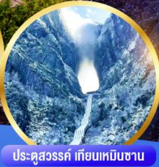
ประตูสวรรค์ เทียนเหมินซาน