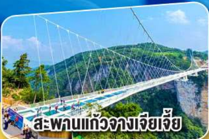
สะพานแกว่งจางเจียเจีย