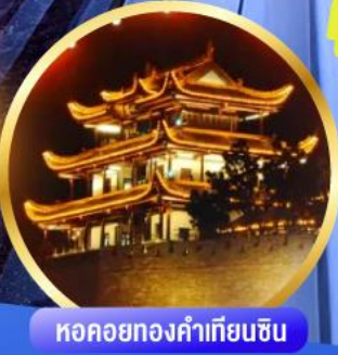
หอคอยทองคำเทียนซิน