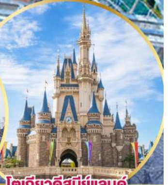
โตเกียวดิสนีย์แลนด์

พิกัดเที่ยว 2 คืน พักออนเซ็น 1 คืน พร้อมเมนูญี่ปุ่น