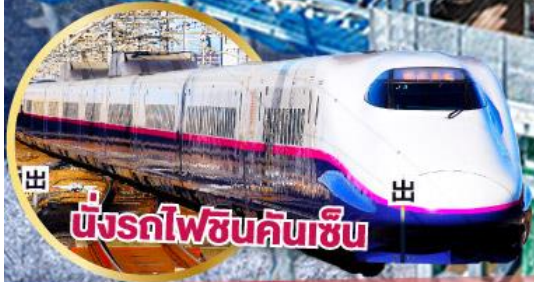
นั่งรถไฟชินคันเซ็น