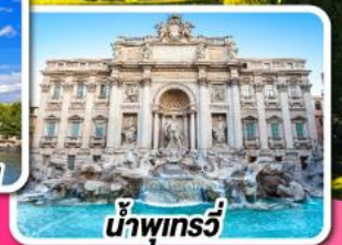
น้ำพุกรวี