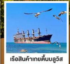
เรือสินค้าเกย์ตันบลูวิส