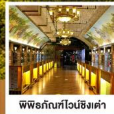
พิพิธภัณฑ์ไวน์ชิงเต่า