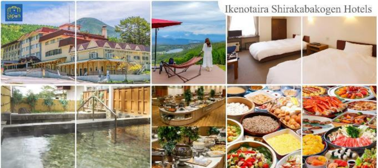
Ikenotaira Shirakabakogen Hotels

หลังอาหารให้ท่านได้ผ่อนคลายกับการแช่น้ำแร่ธรรมชาติ เชื่อว่าถ้าได้แช่น้ำแร่แล้ว จะทำให้ ผิวพรรณสวยงามและช่วยให้ระบบหมุนเวียนโลหิตดีขึ้น