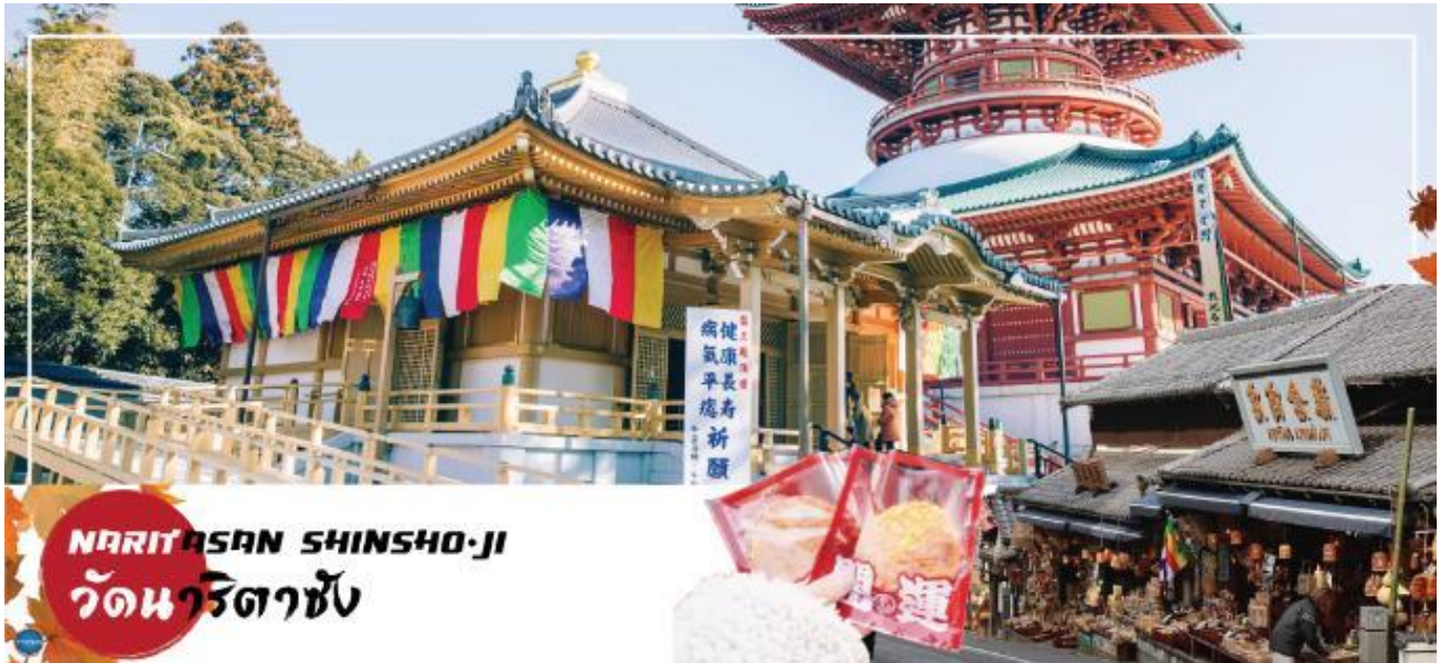
NARITASAN SHINSHO-JI วัดนาริตะซุ