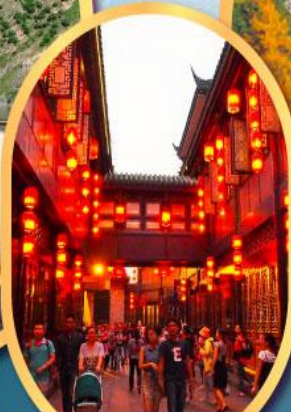
ถนนโบราณจิ้นหลี่