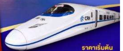
ราคาเริ่มต้น