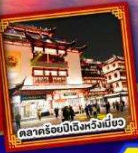
ตลาคร้อยปีถึงหวังเหมียว