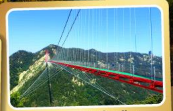
สะพานแขวนอ้ายจ้าย