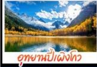
อุทยานป่าแดงโกว