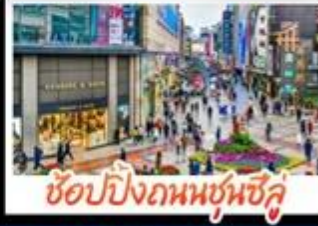
ซ้อมบิงกนบนซุบซึ่