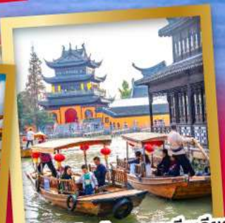
ล่องเรือเมืองโบราณซูโจวเจียเจียว