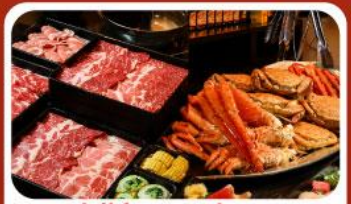
บุฟเฟ่ต์ซาบู ซาปู 3 ชนิด