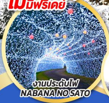
งานประดับไฟ NABANA NO SATO