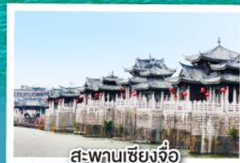
สะพานเซียงจื่อ