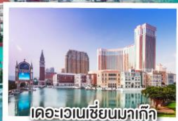
เดอะเวเนเซียนมาเก๊า