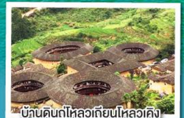
บ้านดินกู่ไหลวเทียนไหลวเค็ง