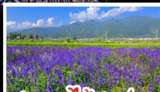
สวนดอกไม้ฮัวมู่ฉาง