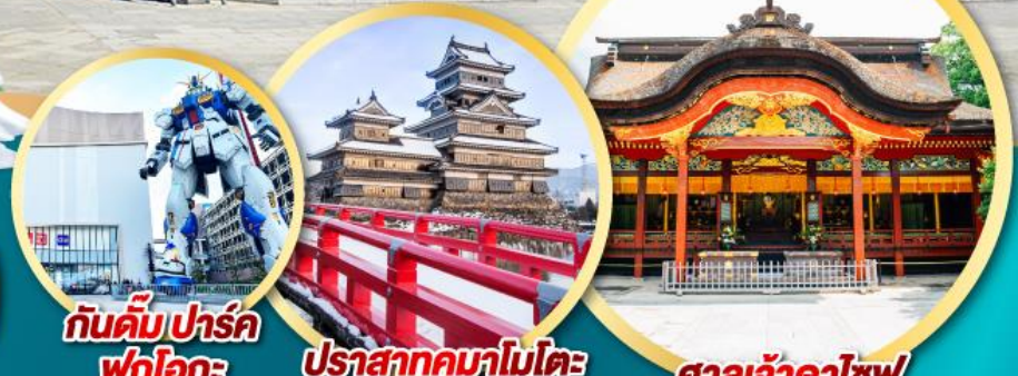
กันดั้มปาร์ค ฟุกุโอกะ