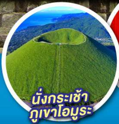
นั่งกระเช้า ภูเขาอินุโระ

จุดชมวิวกุเอะไฟฟูจิ ป่าสนมิโฮะ โนะมัตสึบาระ