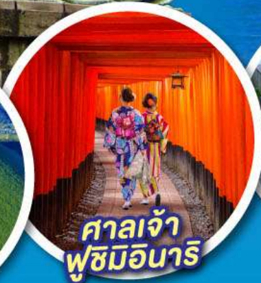
ศาลเจ้า ฟูชิมิอินาริ