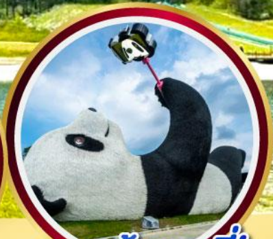
แพนด้าเซลฟ์