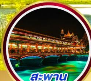
สะพาน หนานเจียว