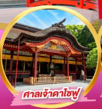
ศาลเจ้าคาไซฟู