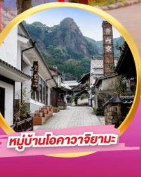
หมู่บ้านโอคาวาจิยามะ