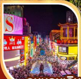
ถนนคนเดิน หวงซิงลู่