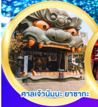
ศาลเจ้านิมบะ ยาชากะ

งานเทศกาลประดับไฟซากามิโกะ อิลลูมินเชั่น พักออนเซ็น 1 คืน พักโฮซาก้า 2 คืน