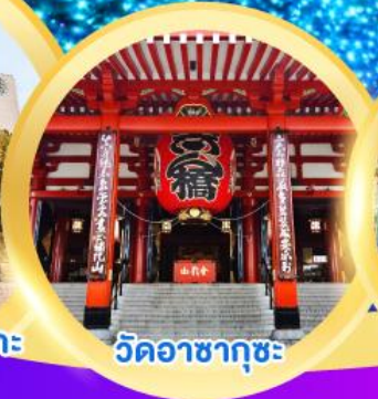
วัดอาซากุสะ