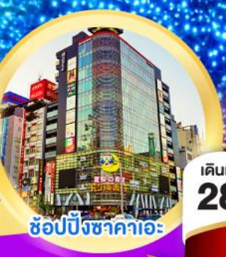
ช้อปปิ้งซากาคาเอะ