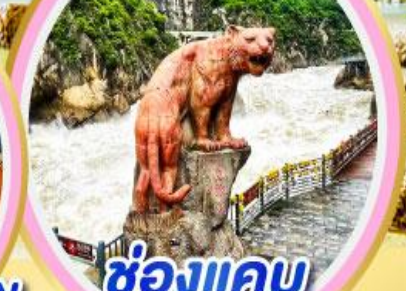
ช่องแคบ เลี้ยวกระโจน