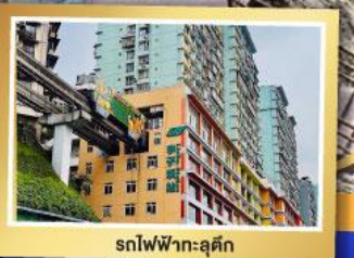
รถไฟฟ้า-อู๋ตัก