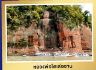
หลวงฟอโตเล่อซาน