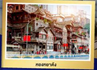
หยงหนาดัง