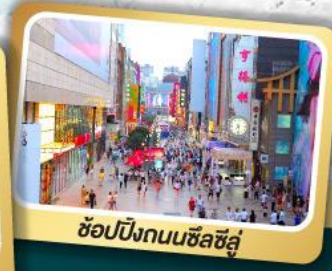
ช้อปปิ้งถนนชิลซิลู่