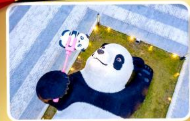
หมีแพนด้าอนเซลฟ์