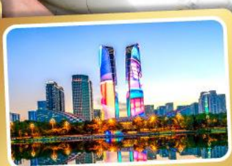
ตึกแฝดเมืองเจ็ทตู