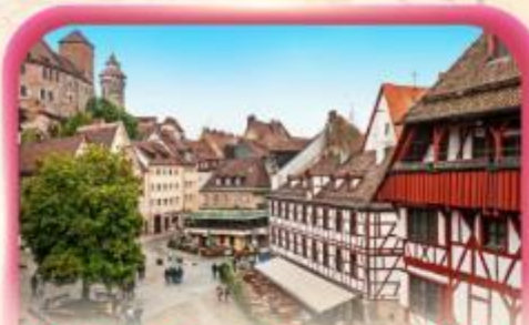
สัมผัสเมืองเก่าบูเรมเบิร์ก