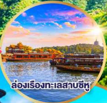
ล่องเรือทะเลสาบซิว